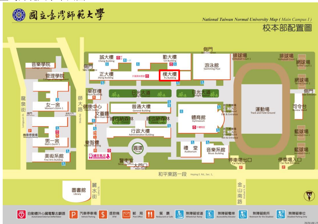
臺灣師範大學平面圖