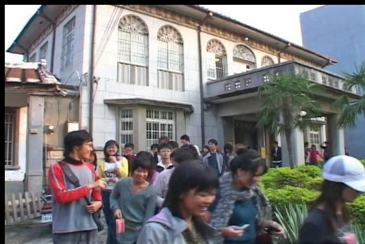
田野調查（人社、傳科）新竹·湖口