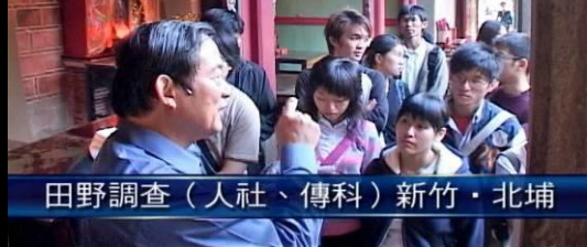
田野調查（人社、傳科）新竹·北埔