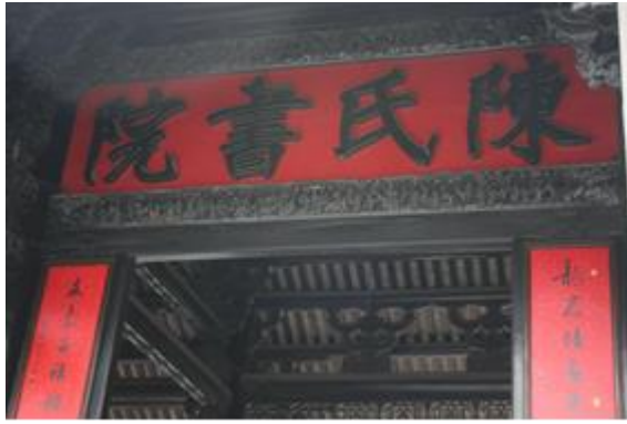
廣州市內陳家祠，現為廣東工藝博物館。

今天下午的行程則是前往位於廣州內的陳家祠。當遊覽車一停在陳家祠前面時，我便被他的壯麗給吸引了，陳家祠占地十分的龐大約一千五百平方公尺，在導遊的簡介當中，我了解到陳家祠是廣州各地的陳氏宗親會所集資而蓋的。迎面看到陳氏書院十分的壯觀，它是一座漢人傳統建築物，大門兩旁另外還有兩座小門，大門的前方還擺放著兩個石獅子，作為一種招財避邪的器具。一踏進去門檻內，木門的背面有兩個大門神的畫像。建築物內的房樑雕刻的十分地精細，每一面牆上都挑刻著一個故事，立體而精緻，上上華麗的色彩，沿著建築物內的周圍繞著，抬頭就可以看到屋頂，屋頂上面有許多的裝飾，有動物也有人，在這座建築物內幾乎看的到的地方都有著精細的布置。由於現在變成是工藝博物館，所以裡面每一間的房間只有簡單的展示當時生活用的器具，其他大部分的房間都用來擺放廣州市政府所要展現的民間工藝，和要賣的工藝品。