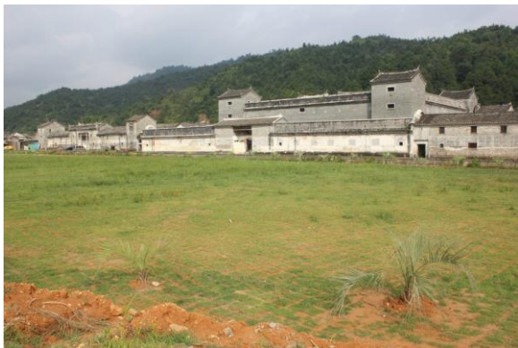
始興縣 客家滿堂圍

今天下午的行程則是前往位於廣州內的陳家祠。當遊覽車一停在陳家祠前面時，我便被他的壯麗給吸引了，陳家祠占地十分的龐大約一千五百平方公尺，在導遊的簡介當中，我了解到陳家祠是廣州各地的陳氏宗親會所集資而蓋的。迎面看到陳氏書院十分的壯觀，它是一座漢人傳統建築物，大門兩旁另外還有兩座小門，大門的前方還擺放著兩個石獅子，作為一種招財避邪的器具。一踏進去門檻內，木門的背面有兩個大門神的畫像。建築物內的房樑雕刻的十分地精細，每一面牆上都挑刻著一個故事，立體而精緻，上上華麗的色彩，沿著建築物內的周圍繞著，抬頭就可以看到屋頂，屋頂上面有許多的裝飾，有動物也有人，在這座建築物內幾乎看的到的地方都有著精細的布置。由於現在變成是工藝博物館，所以裡面每一間的房間只有簡單的展示當時生活用的器具，其他大部分的房間都用來擺放廣州市政府所要展現的民間工藝，和要賣的工藝品。